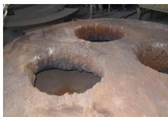
CENTRO VOLTA ALFABLOCK® DOPO 4 SETTIMANE DI USURA E 750 COLATE (foto 4)