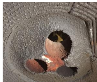
CENTRO VOLTA ALFABLOCK® DOPO 2 SETTIMANE DI USURA (foto 2)