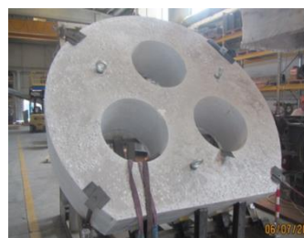
CENTRO VOLTA ALFABLOCK® IN PREFORMATO (foto 1)

Questi sono solo alcuni esempi delle soluzioni Eredi Scabini studiate appositamente per il settore dell'acciaio. Per saperne di più: WWW.EREDISCABINI.COM - SALES_DEPT@EREDISCABINI.COM